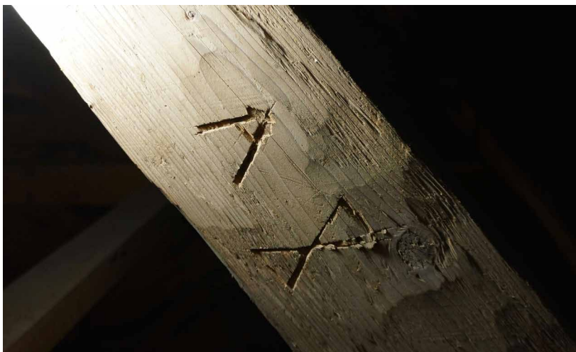
Pohjan kirkon saksessa oleva mahdollinen tekijämerkintä (1470-luku).

mikä ei viittaa vuosisataisten kävijöiden ”vieraskirjana” toimineeseen ullakkoon.