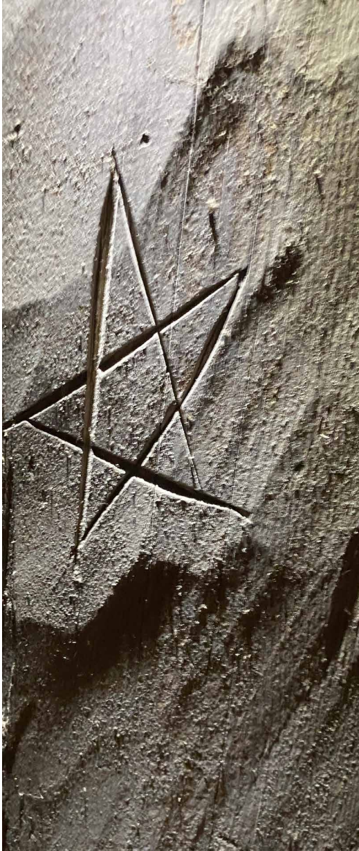
Pentagrammi Espoon kirkon konttipuussa (1480-luku).