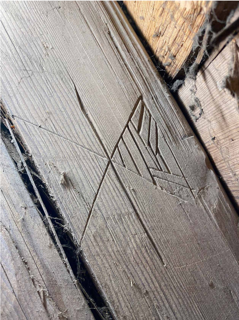
Kaiverros Hauhon kirkon selkäpuussa (1500-luvun alku).

Kokonaisuutena tarkasteltuna rakenteissa olevat merkinnät avaavat useita uusia näkökulmia keskiaikaisten kirkkojen rakentamiseen ja erityisesti rakentamisesta vastanneiden yksilöiden ja yhteisöjen toimin-