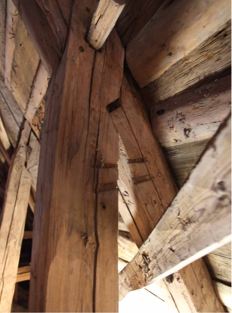
Kohdistusmerkki ja numerointi II Pernajan kirkon selkäpuussa ja kontissa (1440-luku).

niiden välissä oli kaksi rakenteellisesti hennompaa kattotuolia. Pernajalla vain järeämmät kattotuolit on numeroitu I–IIIIII (1–6). 29