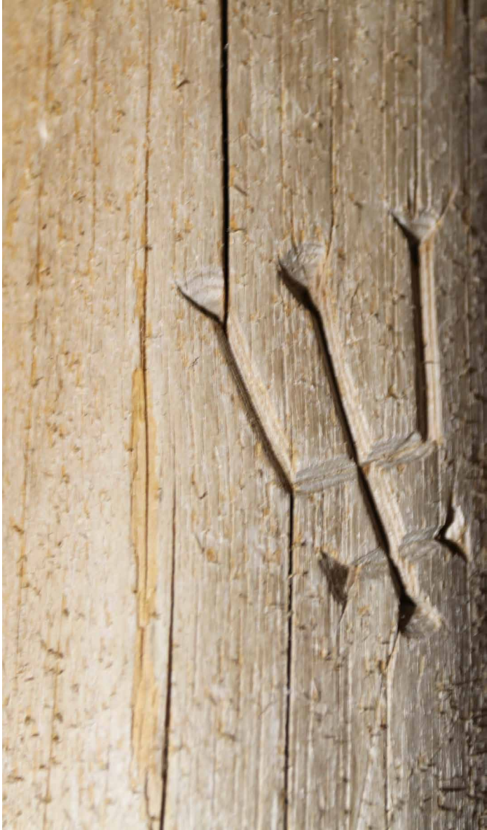
Huolellisesti veistetty puumerkki Keminmaan vanhan kirkon kattorakenteen itäpään yläosassa suoraan alttarin yläpuolella rakenteen harjalla (1550-luku).