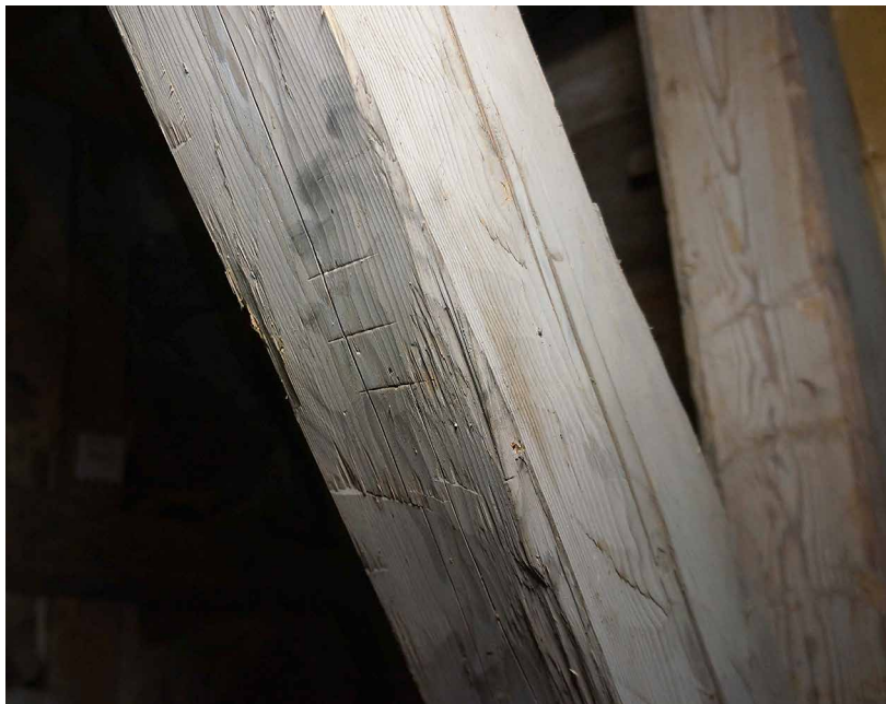
Kattotuolin numerointi Pohjan kirkon saksen alapinnassa (1470-luku).

puun paksuuden mukaan. Sakastien ja asehuoneiden kattotuoleista numeroinnit puuttuvat luultavasti siksi, että ne oli pienen kokonsa vuoksi mahdollista nostaa kokonaisina muurien päälle eikä niitä siis tarvinnut purkaa ja koota uudelleen.