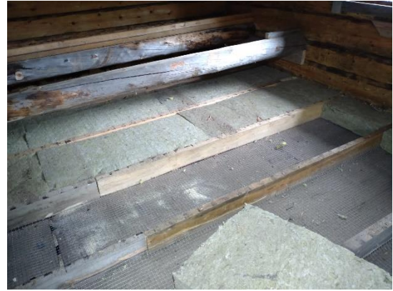
Kuva 8 Villojen purku alapohjarakenteista.