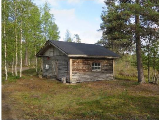
Kuva 7 Iisko Nakkäläjärven kämppi.