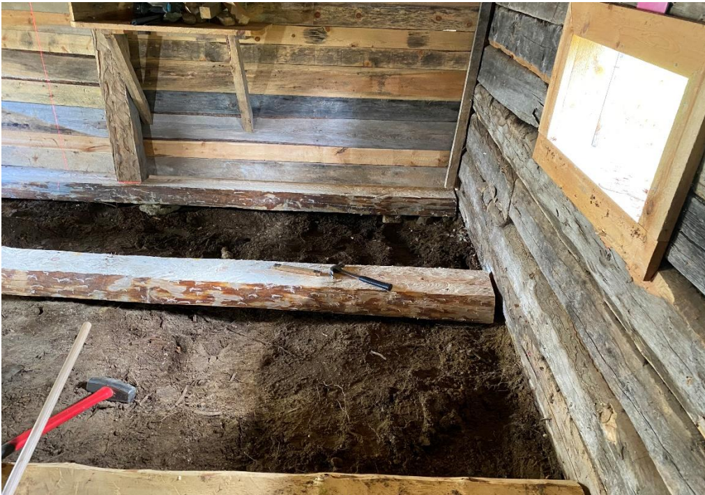
Kuva 12 Länsipään uusien lattianiskojen sovitus ja väliseinän pystytölpän tukeutuminen lattianiskaan.