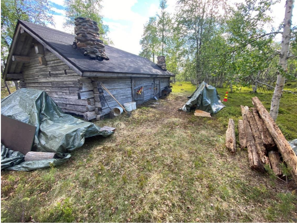
Kuva 4 Kirsti Pokan ja Jouni Jomppaisen kämppä työn alla.