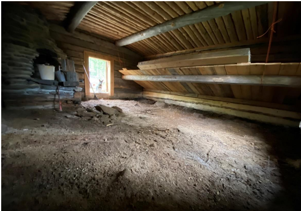
Kuva 1 Antti Maggan kämpän alapohjan puhdistustyö valmiina.