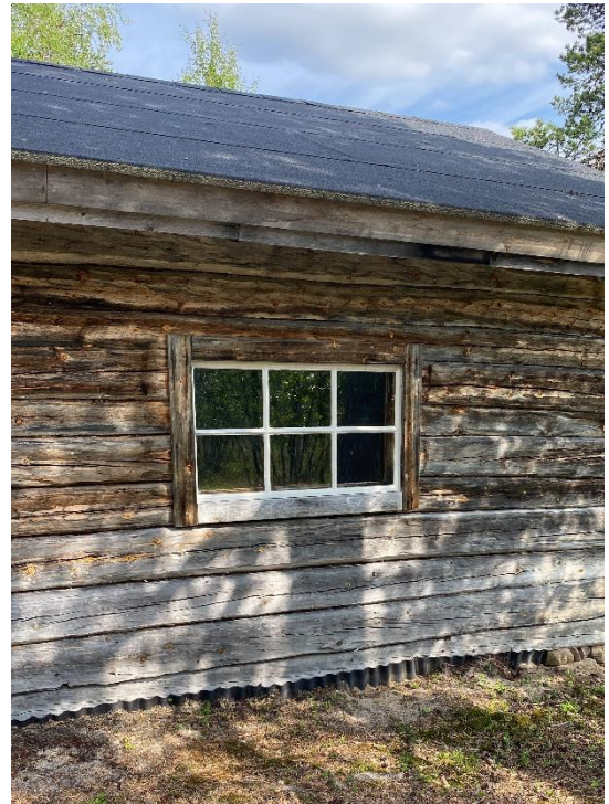
Kuva 10 Kunnostettu ikkunanpuite paikoillaan.