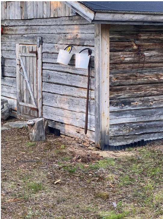
Kuva 9 Kivilatomusta kämpän oviseinustalla.