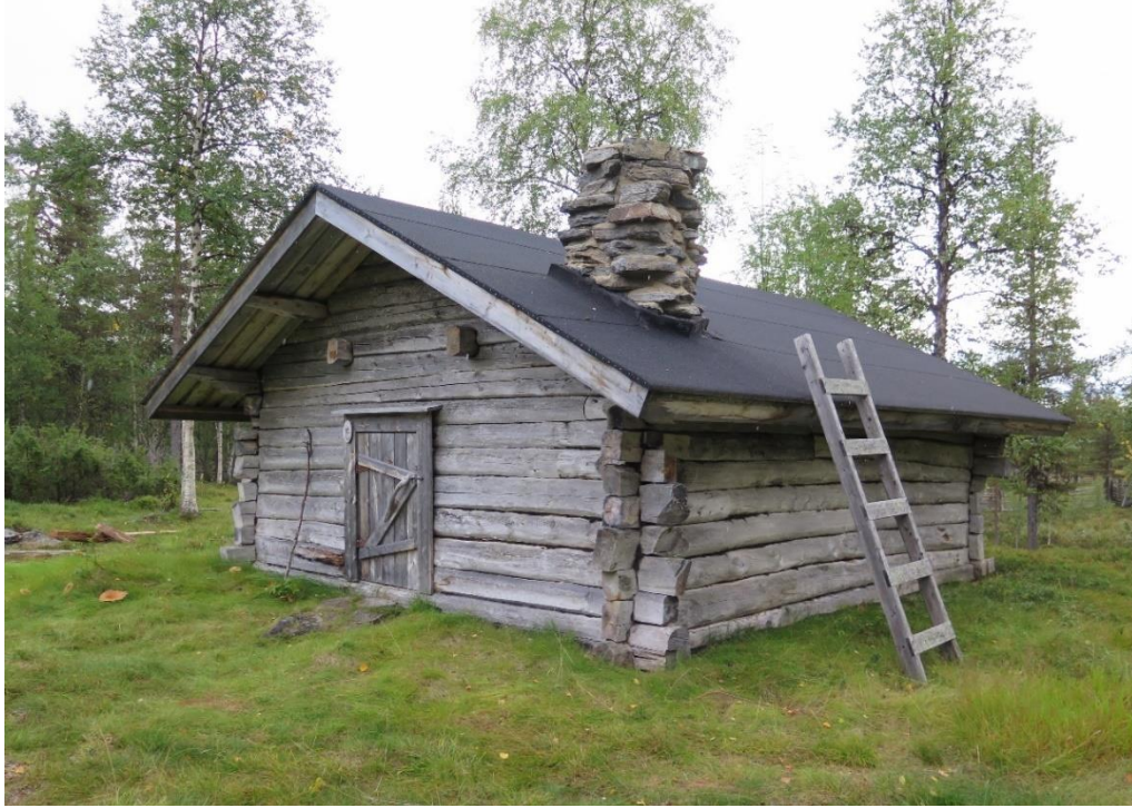
Kuva 2 Antti Maggan kämppä.