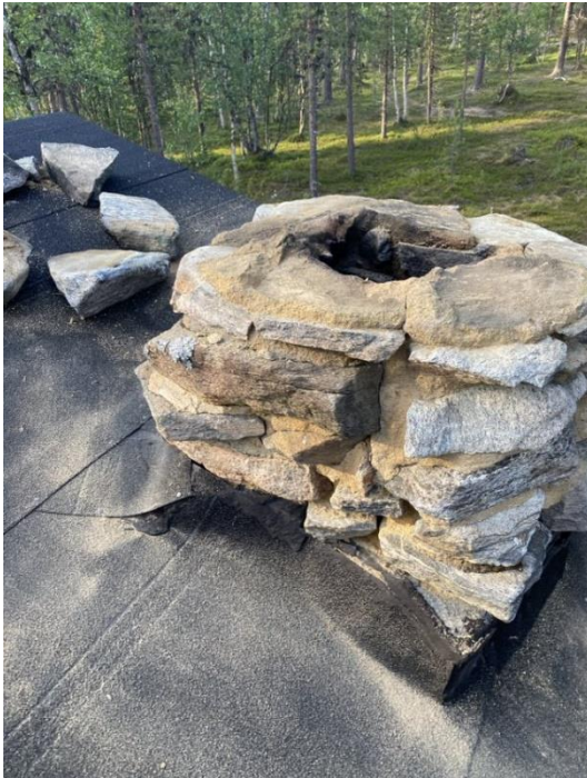
Kuva 5 Kämpän piipusta 3 kivivarvia purettuna.