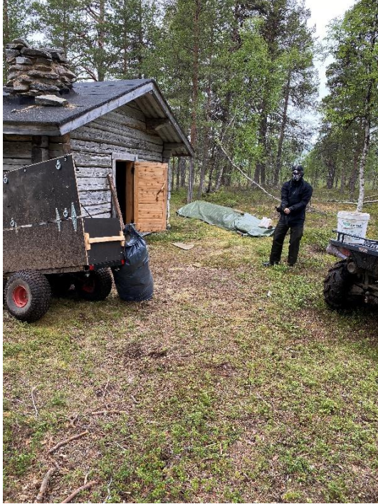
Kuva 3 Kurun kämpän mineraalivillan poisto käynnissä.